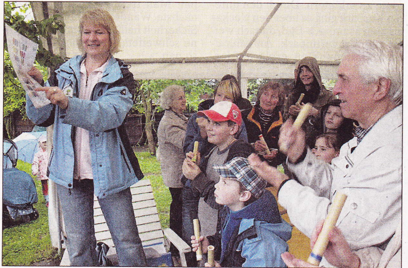
Beim Programmpunkt „Musik zum Mitmachen“ sind im Volltreffer-Garten sowohl die großen als auch die kleinen Besucher gefordert.